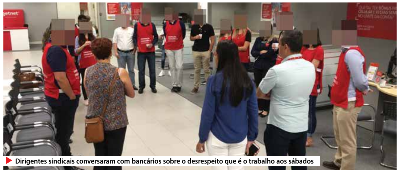
▶ Dirigentes sindicais conversaram com bancários sobre o desrespeito que é o trabalho aos sábados

PROTESTO – O sábado 4 foi o primeiro em que agências estiveram abertas para o projeto do Santander. Segundo o banco, está prevista a abertura de 29 agências em todo o país, todos os sábados dos meses de maio e junho, das 9h às 12h, com palestra